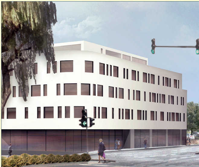
Visualisierung Stand Sommer 2014. Büro Staubach + Partner, Fulda

Durch den Standort in der Innenstadt ist das Altstadt-Carree bequem erreichbar. Gleich nebenan befindet sich das Parkhaus „Q-Park Altstadt“. In geringer Entfernung beginnt die Fußgängerzone mit attraktiven Einkaufsmöglichkeiten. So lässt sich ein Besuch im Altstadt-Carree mit einem Stadtbummel verbinden.